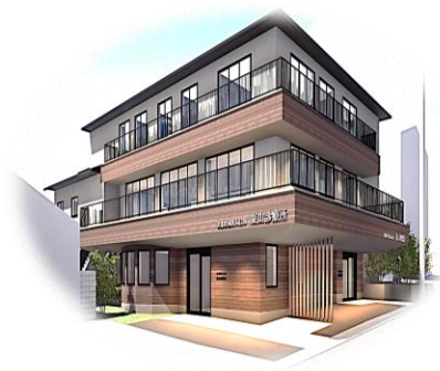
東山診療所完成イメージ